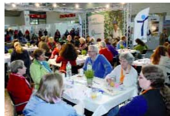
Foto unten links: Nonstop Riesenandrang – das Café der Diakonie Himmelsthür und El Puente lockte die Besucher mit Tomaten-Mozzarella-Strudeln und fair gehandeltem Kaffee an. Foto unten rechts: Kunden aus Wildeshausen und Hildesheim gestalteten eine Bibelarbeit in einfacher Sprache für Menschen mit und ohne Behinderungen.