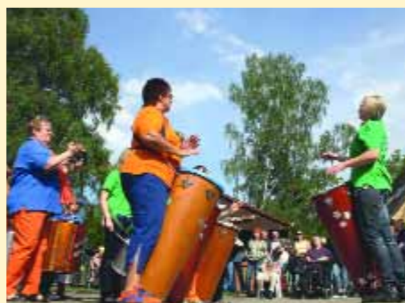
Foto: Die Banda Batida Latina aus Winsen heizte den Besuchern des Diakonie-Sommerfestes mit Samba- und Merengue-Rhythmen ein.