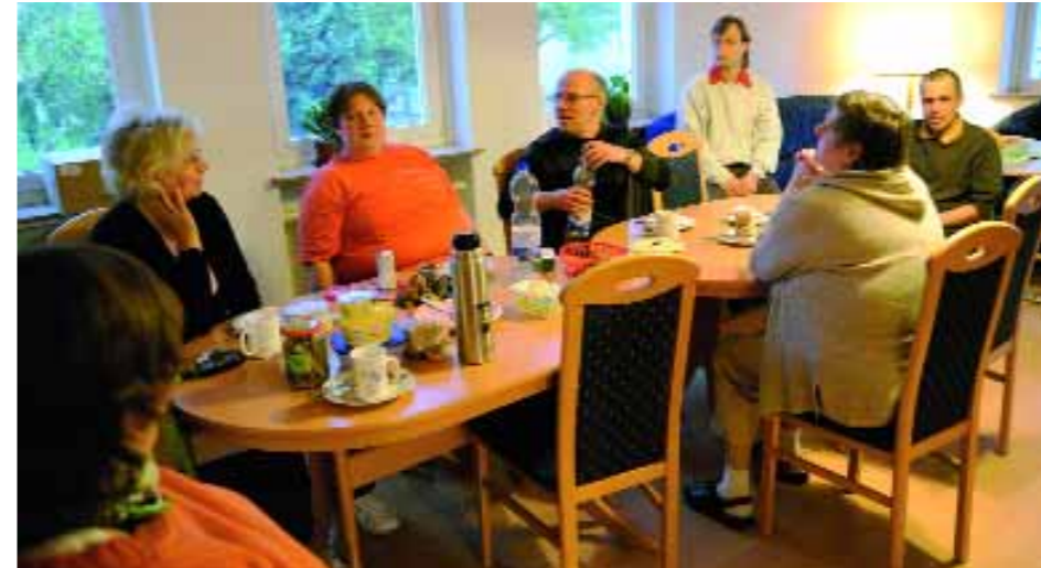
Foto oben: Kaffeeklatschrunde im gemeinsamen Wohnzimmer am Hohnsen

Auch auf dem bisher größten Gelände der Region Hildesheim in Sorsum gibt es positive Veränderungen. Mit großem Engagement planen und entwickeln Mitarbeitende der einzelnen Fachbereiche neue Projekte und geben damit Impulse, die den Lebensalltag der Kunden bereichern und eine Teilhabe in den unterschiedlichsten Bereichen fördern. Bereits im letzten Jahr wurde ein neuer Außenbereich in der Tagesförderung für geschlossene Gruppen geschaffen. Mit Beginn des Sommers 2010 konnte diese als „Strandidyll“ bezeichnete Anlage erstmalig genutzt werden. Die eigenen Wünsche der Teilnehmenden in der Tagesförderung fanden hier Berücksichtigung: es gibt Sonnenschirme auf Sand-