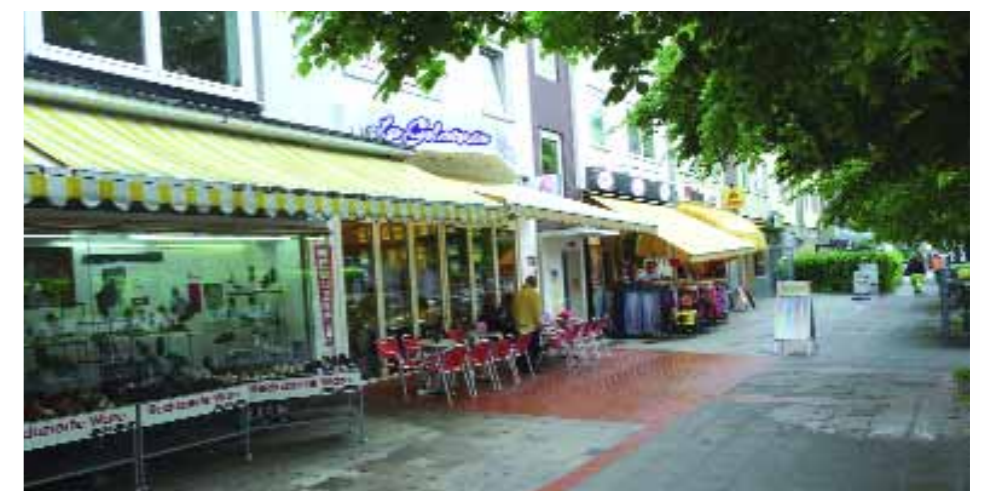
Foto unten: Von den 2-er Wohngemeinschaften ist es nicht weit bis zur Hildesheimer Straße in Hannover

Text: Monika Mai Kundenmanagerin Region Hildesheim